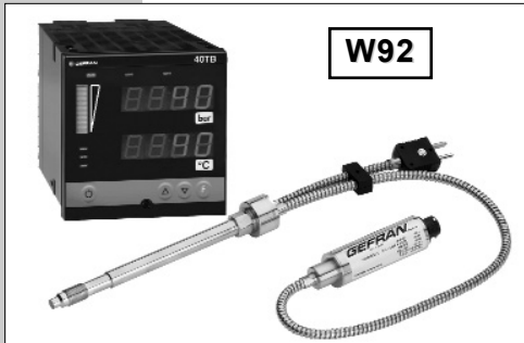
压力/温度可组态，仅需要一个安装孔便可测量两组值。