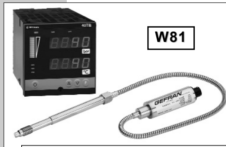
软杆组态用于要求更高热隔离或难以安装的情况