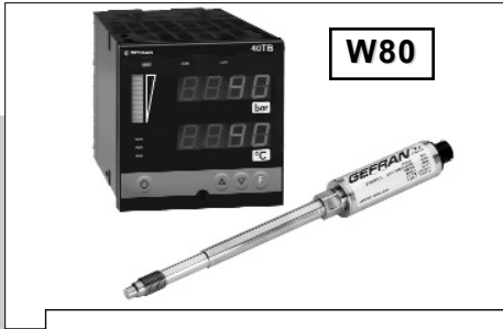
硬杆组态使安装方便快捷