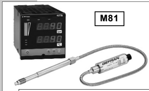
软杆组态用于要求更高热隔离或难以安装的情况