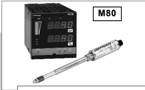
硬杆组态使安装方便快捷